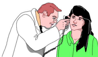
واحد آموزش به بیمار

با دهان باز عطسه و سرفه کنید و از حرکات شدید بپرهیزید.